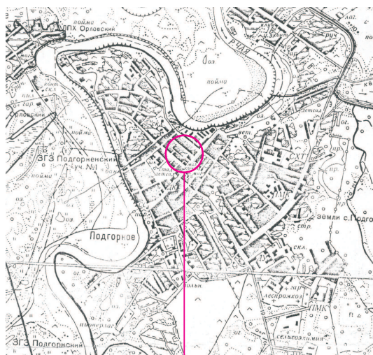
Место расположения благоустраиваемой территории